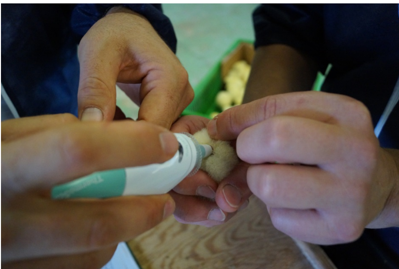
Figur 3. Måling af kyllingers kropstemperatur med øretermometer.