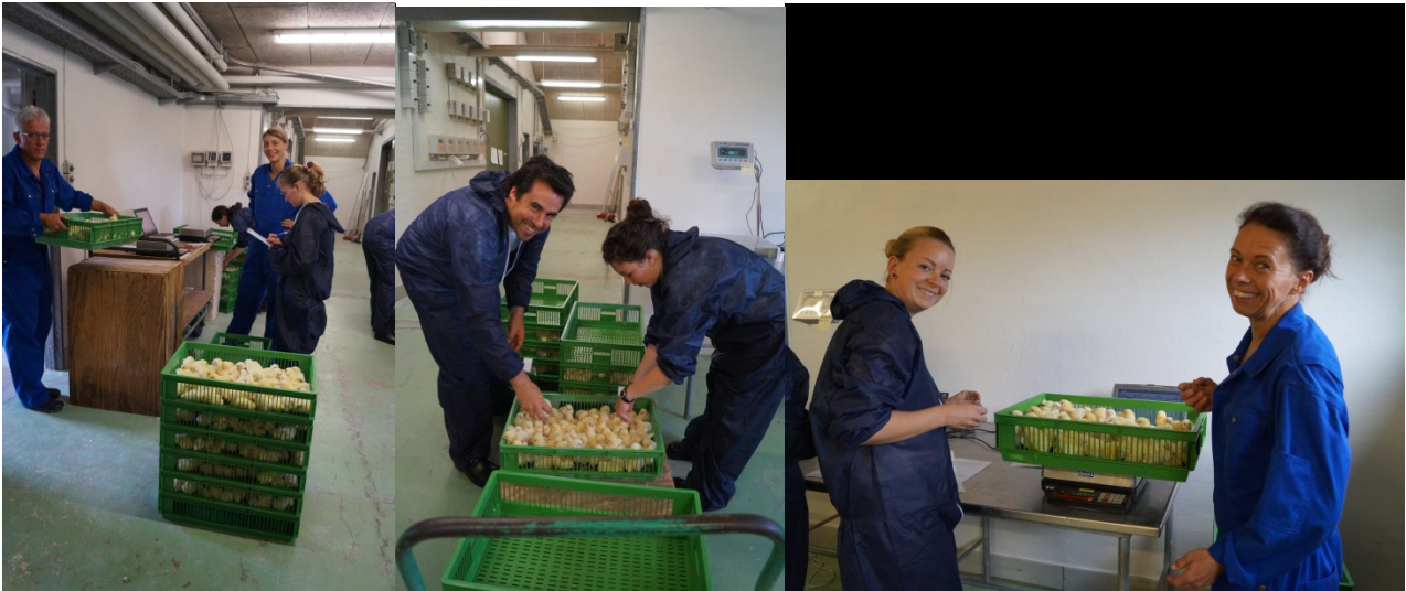
Figur 2. Alle hjælper med at veje, måle og sortere kyllingerne, inden de indsættes i forsøgsbokse.