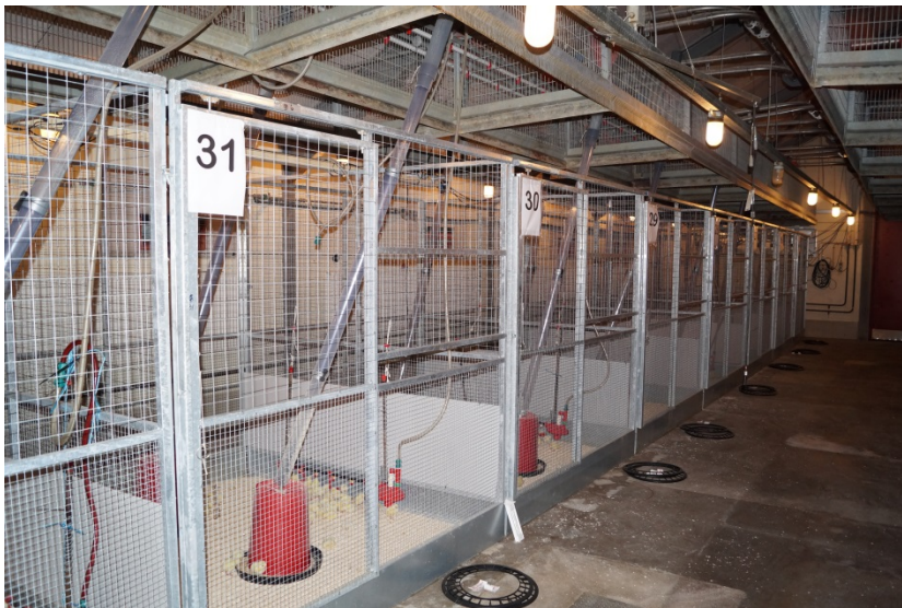
Figur 1. Forsøgsstald til slagtekyllinger ved Århus Universitet.

Forsøget blev gennemført i perioden 2. december 2014 til 5. januar 2015 i Århus Universitets fjerkræstalde i Foulum. Forsøget omfattede i alt 48 forsøgsenheder / bokse, hvoraf de 24 var i stald 42-3, hvor der anvendtes "Normal" opstartstemperatur, mens de resterende 24 bokse var i stald 42-4, hvor der anvendtes "Høj" opstartstemperatur. Hver boks var på 1,3 m 2 , og indrettet med 1 foderskål samt 5 drikkenipler med drypbakke. Alle boksene var strøet med træspåner, og der blev indsat 28 kyllinger i hver boks (14 høner og 14 haner). DanHatch leverede kyllingerne, der var af afstamningen Ross 308. Den ene halvdelen var efter en forældredyrsflok på 28 uger (nr. 153) mens de andre var efter en forældredyrsflok på 50 uger (nr. 197). Alle kyllingerne fik foder fra DLG, der blev fortyndet med 5 til 31% hel hvede. Kyllingerne blev vejlet på dag 0, 7 og 34. Her blev deres foderforbrug også registreret. Derudover blev kyllingernes kropstemperatur målt på dag 0 straks efter ankomsten, samt 5 og 24 timer derefter. Målingen blev udført med et elektronisk øretermometer i kyllingernes kloakåbning.